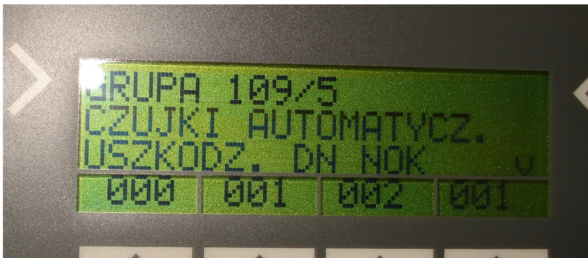
Zdj. Nr 2