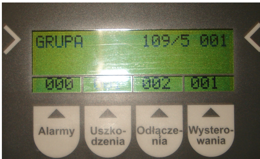
Zdj. Nr 1