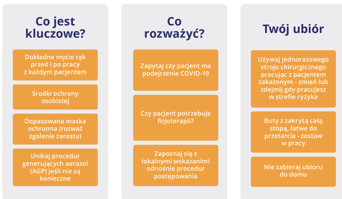
Ryc.2. Powyższy diagram przedstawia zalecenia bezpieczeństwa dla fizjoterapeutów.